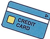
クレジットカード